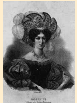
Prinzessin Josephine von Leuchtenberg, Königin von Schweden

Der königlich-bayerische Getreidekasten wird am 14. März 1853 Ihrer Majestät Donna Amelie Kaiserinwitwe von Brasilien um 2225 Gulden verkauft und erhält die Hausnummer 155. Gleichzeitig erwirbt Donna Amelie vom Königreich Bayern den 148 Tagwerk großen Klostersee um 1200 Gulden.