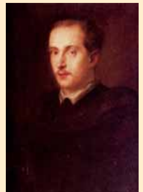
Herzog Nikolaus von Leuchtenberg

Seine kaiserliche Hoheit Herzog Nikolaus von Leuchtenberg Fürst Romanowsky (1843–1891) erwirbt am 20. September 1873 die ehemalige Klosteranlage, den Maierhof und den Getreidekasten.