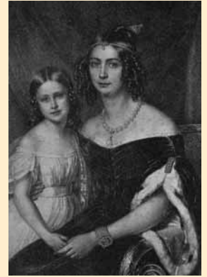
Prinzessin Amelie von Leuchtenberg, Kaiserin von Brasilien, mit Tochter

Ihre Majestät Donna Amelie Kaiserinwitwe von Brasilien, Herzogin von Braganza, geborene Prinzessin von Leuchtenberg (1812–1873), erwirbt am 28. Oktober 1852 die ehemalige Klosteranlage (Hsnr. 152, 154) und den Maierhof (Hsnr. 156; ohne Getreidekasten) mit einem Grundbesitz zu 991,64 Tagwerk um die Summe von 113 000 Gulden. Donna Amelie hatte schon 1845 das umfangreiche Schloßgut Stein a. d. Traun als Witwensitz erworben.